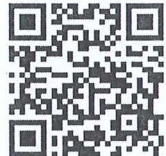
報名 QR code

合格認證：全程參與課程並完成學習評估者，由中華民國中醫師公會全國聯合會核發「運動禁藥諮詢中醫師培訓證書」